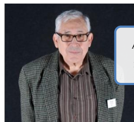
CLAUDE LE MINOR