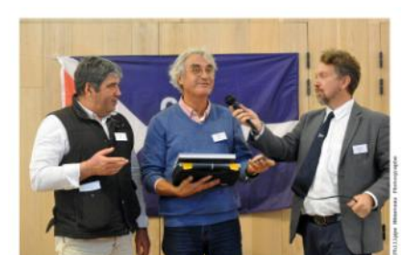
2 e du CCMA Petits bateaux