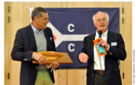
Remise demi coque Patch