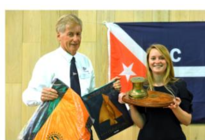
Classement CCMA des Equipiers