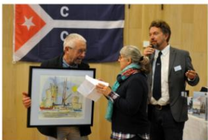
Remise des Neptunes