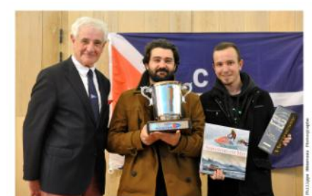
Défi des Midships