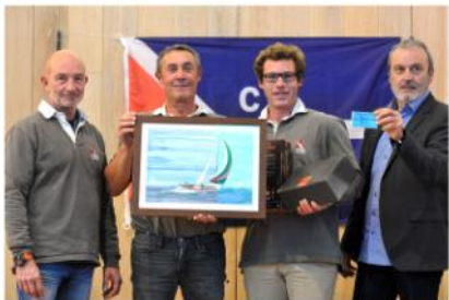
Classement CCMA classe 1/2