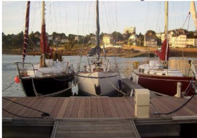
MUSICA, RAAN et MTT

Le petit plus : concours photos (à suivre en consultant régulièrement le site du Yacht Club de Trébeurden