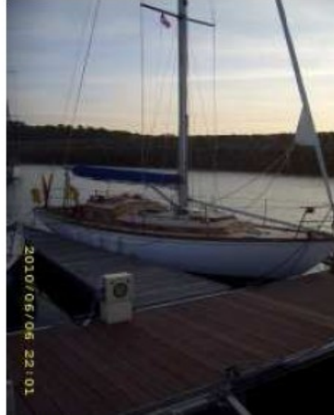
TEMERAIRE et JANESSA les jumeaux anglais